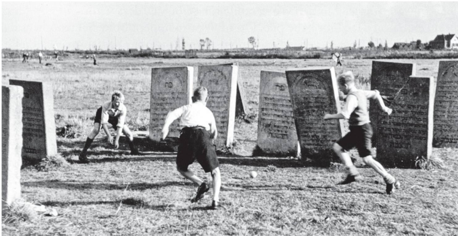
Kinderen uit de Indische buurt voetballen tussen de grafstenen van de joodse begraafplaats Zeeburg, ergens in de jaren vijftig.

Het boek dat historicus Bart Wallet over de Joodse begraafplaats Zeeburg schreef, laat zien dat een begraafplaats meer dan een dodenakker is. De zerken vertellen wie er begraven liggen, hoe oud ze werden en soms ook wat ze deden in het dagelijks leven. Een begraafplaats is een versteend portret van een samenleving die er niet meer is. De geschiedenis van een begraafplaats is daarom ook de geschiedenis van de groep die er begraven ligt. Zo is het ook met het boek van Wallet: het zegt evenveel over Zeeburg als over de Amsterdamse Joden die op Zeeburg en later in Diemen begraven werden.